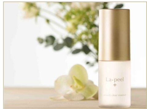
いつものスキンケアにプラスするだけで、 美肌環境を整え、いつでも自信を持てる素肌に

美容液には“美肌菌”だけを育てる、オリゴ糖由来の美容成分「グルカンオリゴサッカリド」を配合しています。また、代表的な善玉菌の一種「乳酸桿菌(にゆうさんかんきん)」も配合し、お肌のターンオーバーの乱れを整えます。